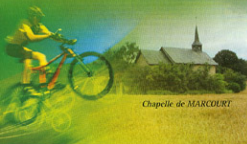
Chapelle de MARCOURT