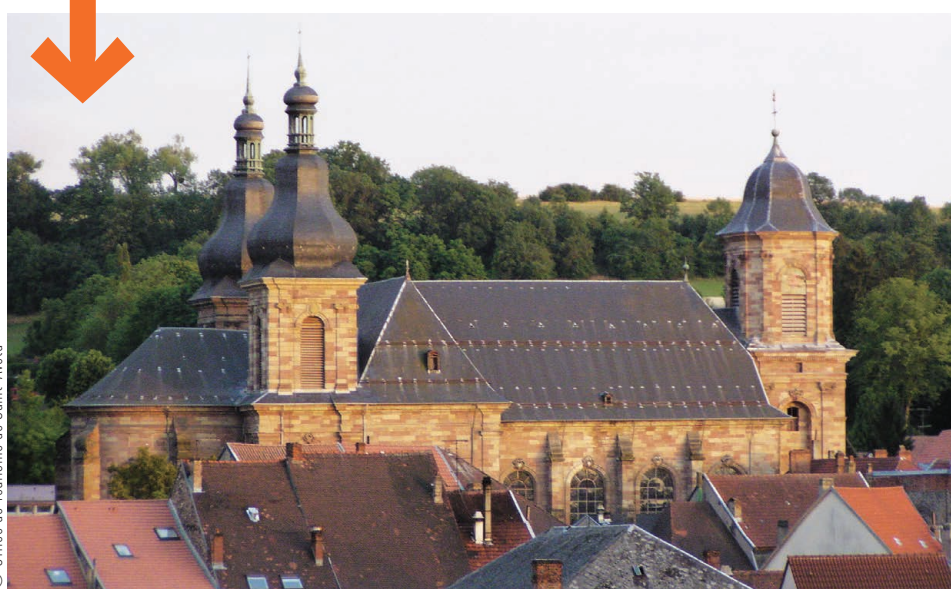
À SAINT-AVOLD L'ÉGLISE ABBATIALE DE SAINT-NABOR