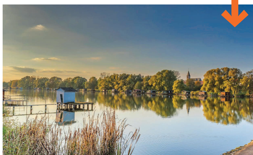
L'ÉTANG BAS DE HOSTE