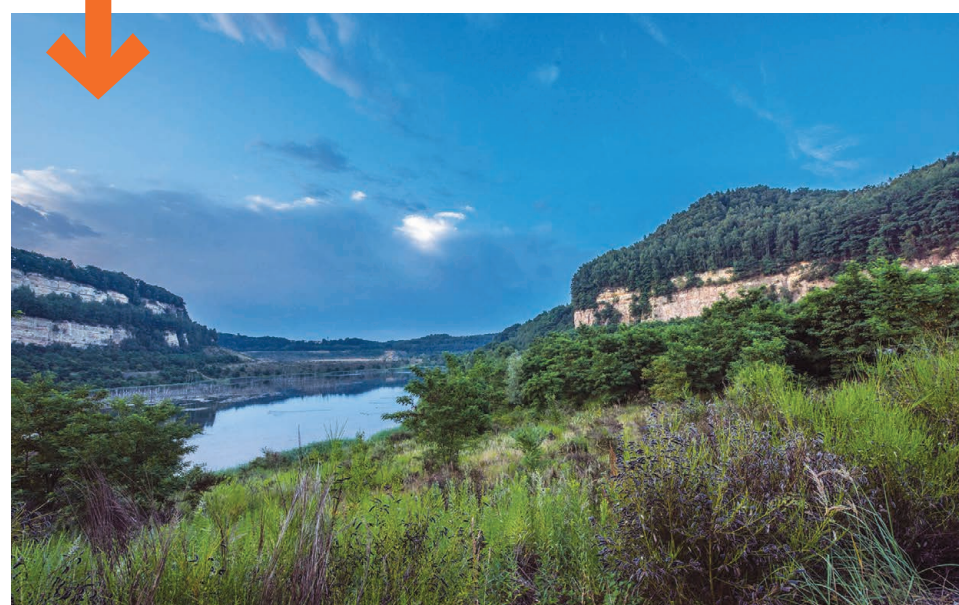
LES CARRIÈRES DE FREYMING-MERLEBACH