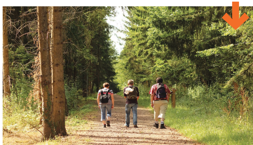
RANDONNÉE EN FORÊT DU WARNDT