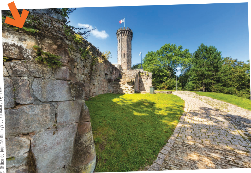
PARC DU SCHLOSSBERG À FORBACH