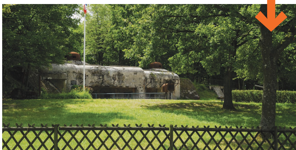
FORT DU BAMBESCH À BAMBIDERSTROFF